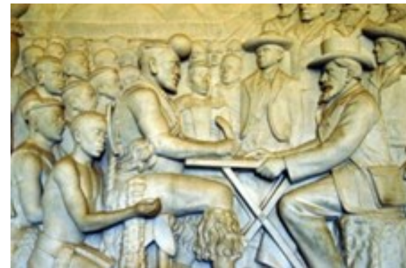
Ondertekening van Traktaat tussen Dingaan en Retief (Fresko van Italiaanse marmar, Voortrekkermonument)